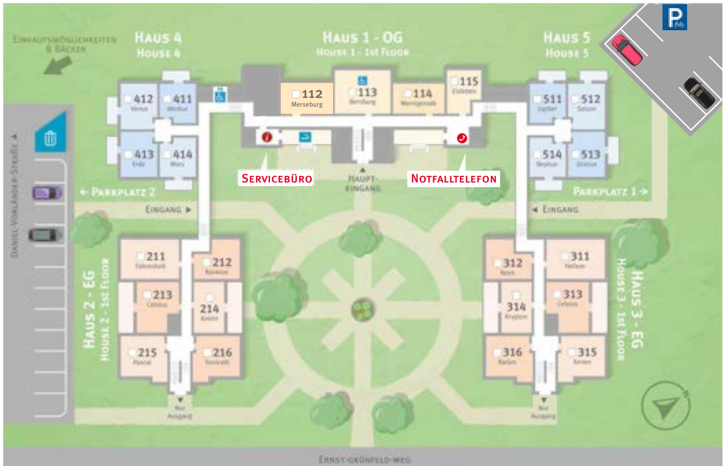
Erdgeschoss · 1. Floor