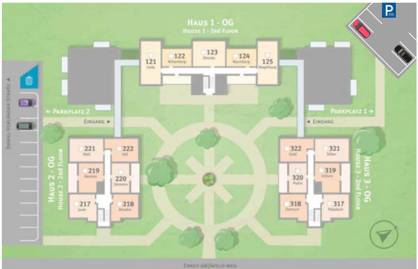
Obergeschoss · 2. Floor