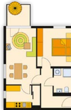
2-Raum-Wohnung, ca. 53 m 2