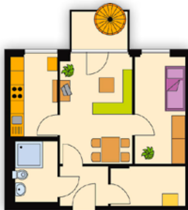
2-Raum-Wohnung, ca. 49 m 2