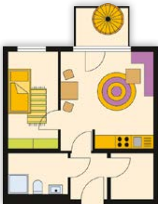
2-Raum-Wohnung, ca. 42 m 2